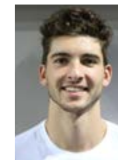
Thimothée CARLE AS Cannes