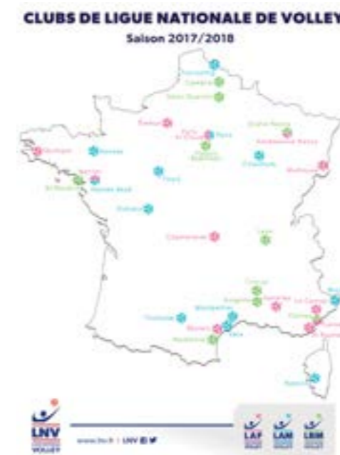
Cliquez sur la cartographie pour la télécharger

Avignon Cambrai Cannes Lyon Nancy Narbonne Orange Plessis-Robinson St-Nazaire St-Quentin